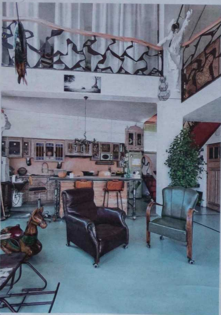
Bouwheer Frank nam zijn tijd om alle materialen en spullen tweedehands bij elkaar te sprokkelen.

Met veel creativiteit en met oude materialen gaf de eigenaar deze nieuwbouw een ziel. Een open uitzicht op de natuur, een ingenieus spel met split levels en een overvloedige lichtinval maken het plaatje compleet. VEERLE BEIRNAERT