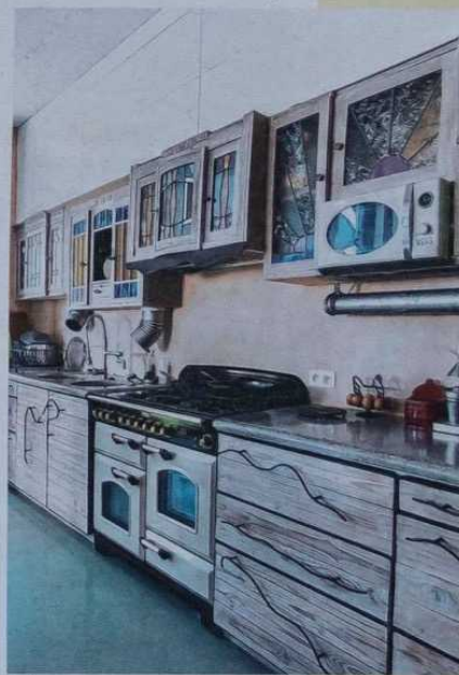
De keuken: een compositie van kasten.

'Ik wilde alles zelf doen met tweedehands materialen. Dat is een intens proces en dat mag je niet overhaasten'