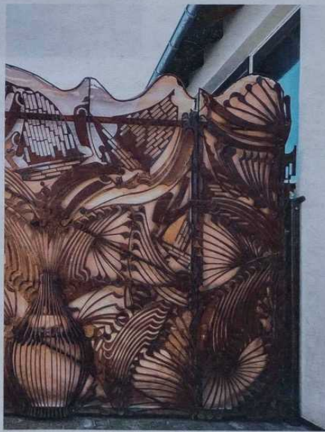
De monumentale poort werd gemaakt uit restjes metaalplaten.

De vormen en het reliëf van de poort zien er fascinerend uit. Wie